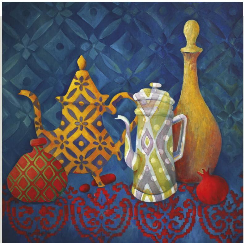
Jugs Not Jugs 1. 2021. Huile sur toile, 80 x 80 cm.

« Le sac à main d'une femme contient tout son univers. Ses secrets y sont gardés bien à l'abri. De nombreux créateurs de mode en font d'ailleurs leur emblème. J'ai décidé de rendre hommage aux créations de toutes époques et d'incarner l'image du sac à main dans ma série "Glamour" ».