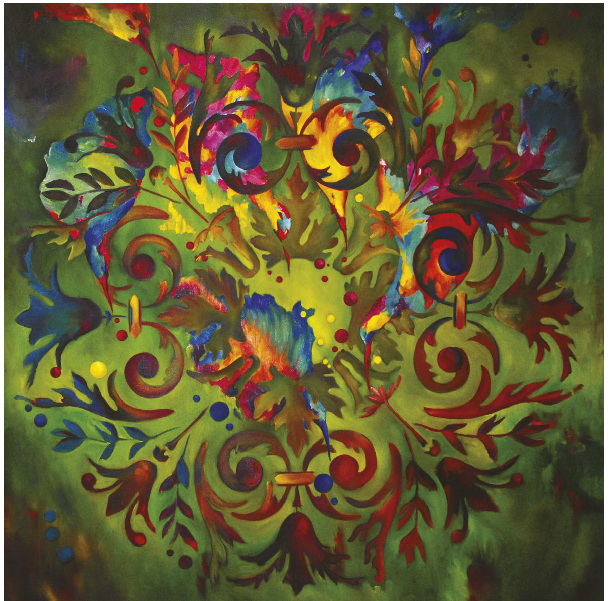
Birds and Berries . 2021. Huile sur toile, 110 x 110 cm.