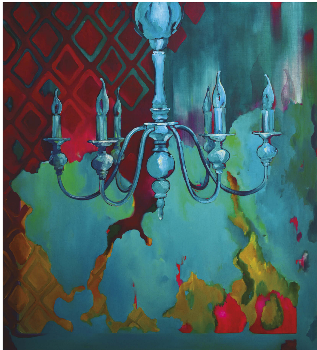
Vintage Style. 2021. Huile sur toile, 110 x 100 cm.

Je peins de grandes toiles parce que mes œuvres sont destinées à être exposées dans un grand espace ou un lieu public, comme un restaurant. Les grands tableaux ne sont pas difficiles à travailler, les détails sont plus faciles à exécuter que sur les petits. Vous devez d'abord exécuter de petites esquisses préparatoires, puis les agrandir à l'échelle de votre toile. Le plus important à ce moment-là, c'est de ressentir la paix dans votre esprit, d'avoir le désir de vous consacrer pour de nombreuses heures à la peinture. D'entrer dans l'espace de la toile et de construire un nouveau monde à chaque coup de pinceau.