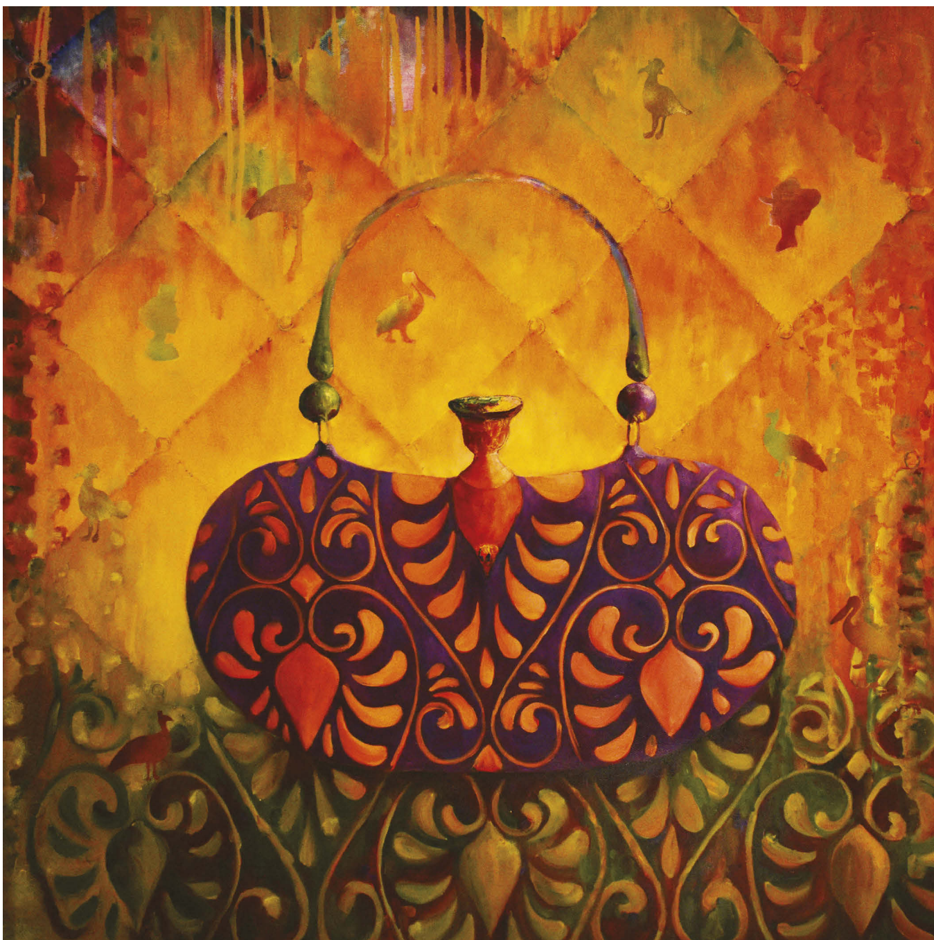
BB. Série « Glamour ». 2021. Huile sur toile, 80 x 80 cm.

4 En tant qu'artiste, vous ne devez pas être intrusif et tout faire pour persuader un acheteur potentiel. Au contraire, vous devez être invisible. C'est votre création qui parle pour vous.